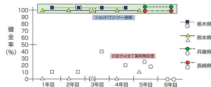
林業薬剤協会委託試験成績(1994~1998, 2010~2011年)