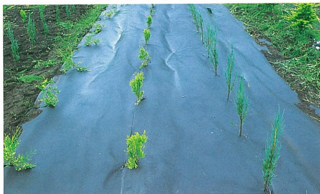
植栽地などの抑草シートに