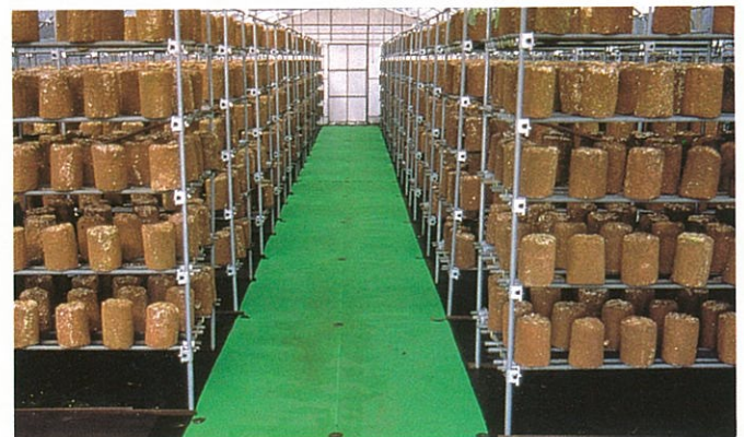
ハウス底面のコンクリート代替に (緑色の部分はプラスチックネットを被覆)