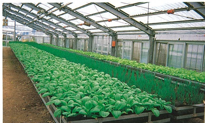
高架栽培用のベツに