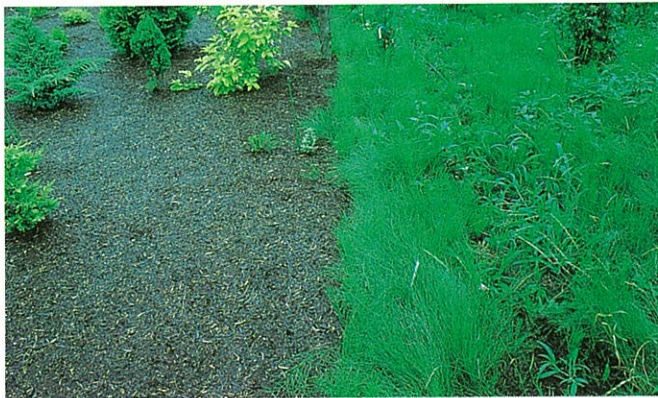
さまざまな場面の抑草に (チップ材の下に敷いてあります。)