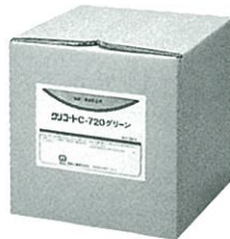
液体 20kg ダンボール箱入り